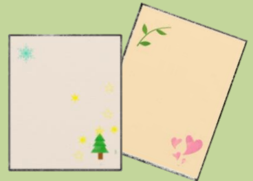
好きな材料でデコレーション